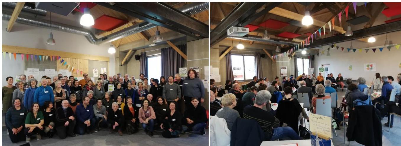
Lors de la Rencontre Nationale des AMAP, Bergerie de Villarceaux (95), 8 février 2020